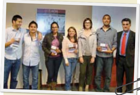
Grupo Polifemo, del MBA Internacional de EADA