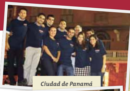
Ciudad de Panamá