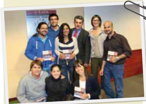
Grupo Penélope, del MBA Internacional de EADA

Desde EADA queremos felicitar a los ganadores y a todos los que participaron por su gran esfuerzo durante estos meses. ←