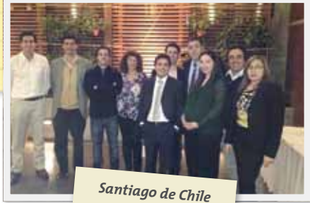
Santiago de Chile