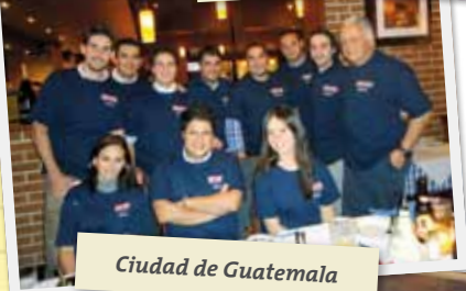
Ciudad de Guatemala